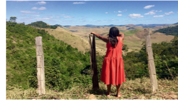
Nuhu yãg mu yôg hãm

Un an après la destitution de Dilma Rousseff, et alors que les parlementaires brésiliens font reculer les droits des peuples autochtones, une gigantesque mobilisation autochtone a lieu à Brasilia lors de la 14 ème édition du camp Terre Libre.