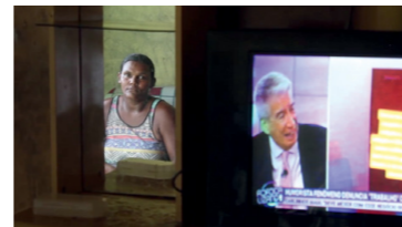
The Coup d'état Factory