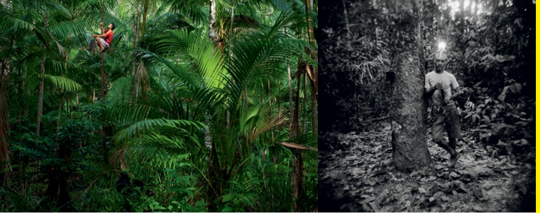
Les Gardiens de l'Amazonie