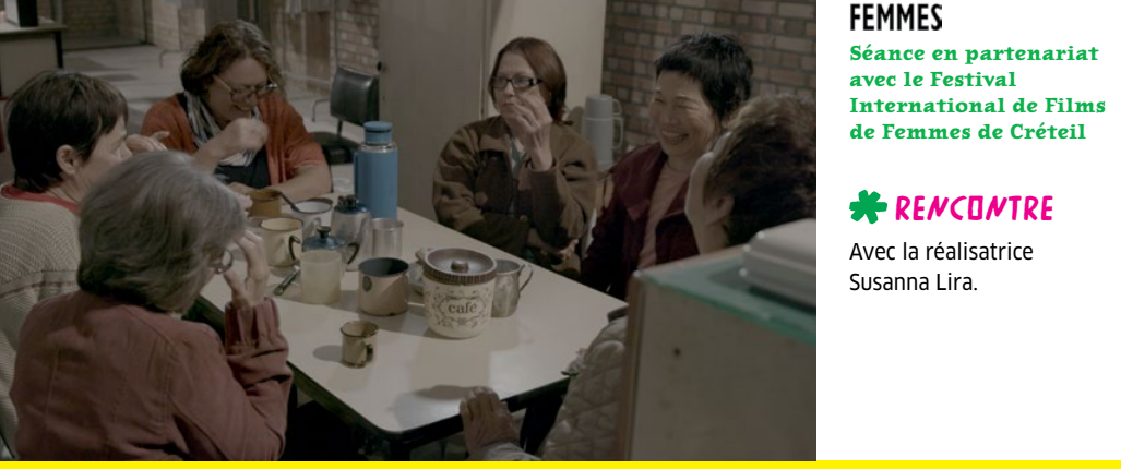
Torre das donzelas

FILMS FEMMES Séance en partenariat avec le Festival International de Films de Femmes de Créteil