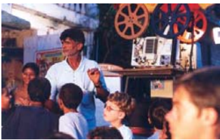
Mini ciné tupy