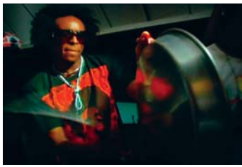
Du hip hop assaisonné au dendê