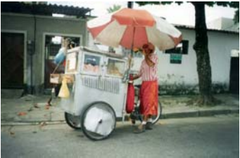
En roue libre

Au départ : la roue, une invention vieille de sept milles ans, à l'origine d'une révolution. À l'arrivée : le portrait du quotidien d'un petit nombre d'habitants de Rio de Janeiro qui, à l'aide de véhicules non motorisés, gagnent leurs vies dans les rues de la mégapole. Rencontre avec le réalisateur Sérgio Bloch (sous-réserve).