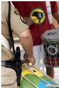
Jeunesse et police